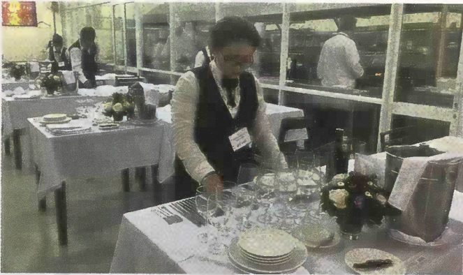
Ein Auszubildender bei der praktischen ...

Weltweit unterstützt die Stiftung Hilfswerk Deutscher Zahnärzte (HDZ) Projekte, um die soziale und die (zahn-)medizinische Not zu lindern. Anfang dieses Jahres konnte in Saigon schon das zweite vom HDZ unterstützte Lehrrestaurant eröffnet werden. Darin bekommen Jugendliche aus prekären Verhältnissen eine Lebenschance, indem sie zu Gastronomiefachleuten ausgebildet werden.