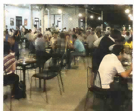
Viele Gäste kamen zur Einweihungsfeier des Lehrrestaurants.