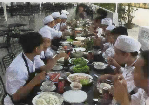
Die Auszubildenden im Lehrrestaurant